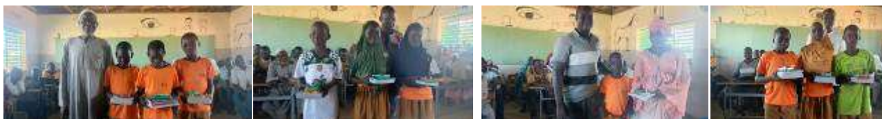
Remise de prix lors de la clôture de fin d'année scolaire (soutenue par Zinado 2000)