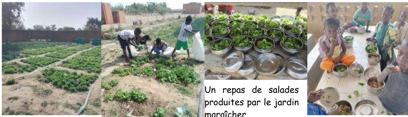
Un repas de salades produites par le jardin maraîcher

Au Certificat d'Etudes Primaires, Bouglem a eu 40 élèves reçus sur 41, soit un taux de succès remarquable de 98% (contre 65% l'an dernier).