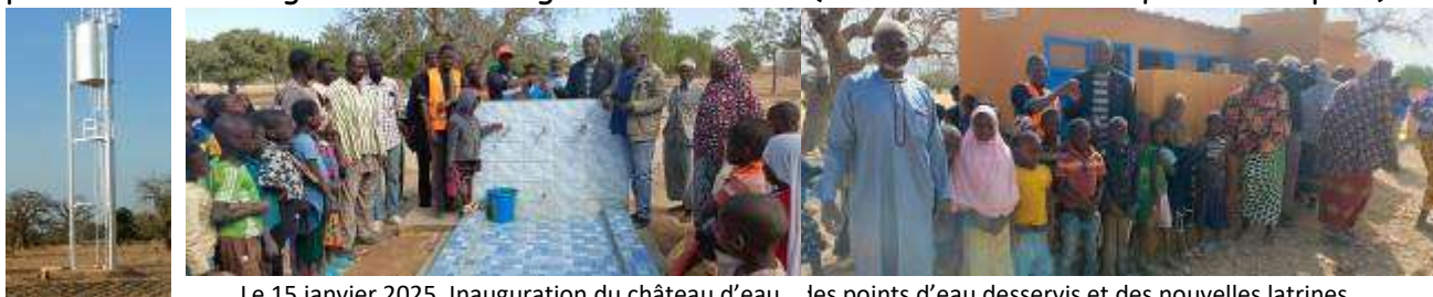
Le 15 janvier 2025, Inauguration du château d'eau, les points d'eau desservis et des nouvelles latrines