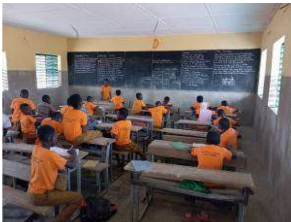
Photo, après restauration, du 1 er bâtiment de l'école de Zinado construit en 2000