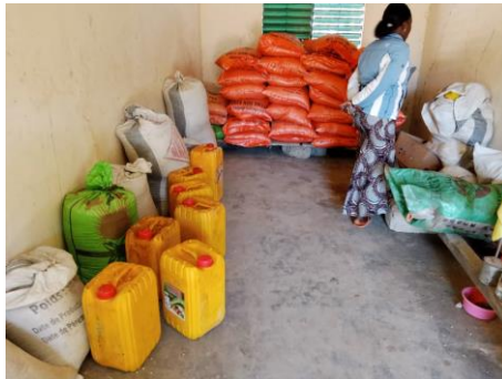
1 ère fourniture de vivres (01/2022)