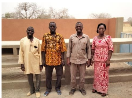
14 mars Réception des travaux

Suite à l'arrivée de l'eau à l'école de Bouglem et à la réalisation d'un maraîchage grâce à notre projet 2021, nous avons financé la construction d'une cuisine améliorée identique à celles des 3 écoles que nous soutenons. Grâce aux champs scolaires, au maraîchage et à la contribution des parents d'élèves, les élèves pourront être nourris le midi au moins pendant la saison chaude.