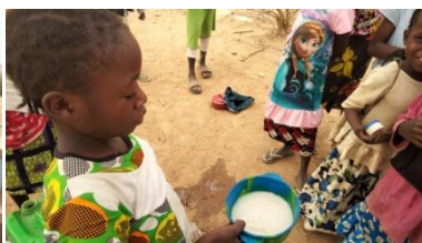
Le 16 mars 2022 début de la cantine scolaire