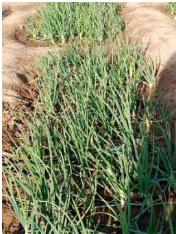
Une belle récolte d'oignons attendue

Comme les années précédentes, les 334 élèves de l'école ont pu être nourris pendant toute l'année scolaire. D'abord grâce à la culture d'un champ scolaire pendant la saison des pluies (juin à septembre) par les élèves et leurs parents, complété par chaque parent d'un apport de haricots. Puis par l'association Zinado 2000 qui a fourni des vivres pour le second trimestre et le dernier trimestre, l'Etat burkinabé n'ayant pas fourni de vivres cette année.