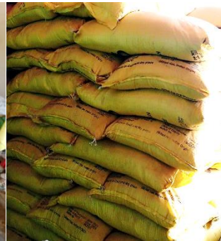
3 ème fourniture de riz