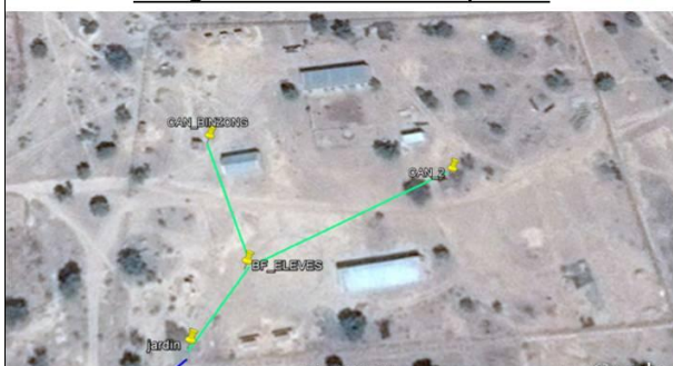
Plan détaillé de l'implantation du réseau à l'école