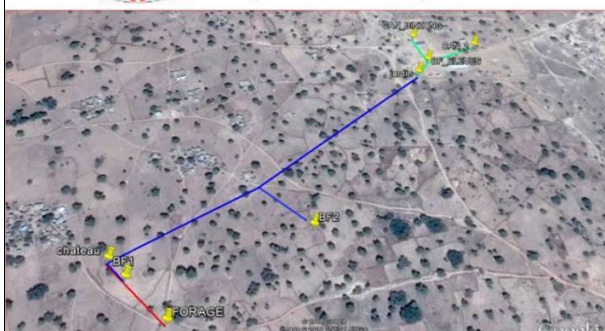
Plan général du réseau d'eau potable