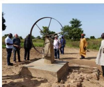
Pompe manuelle actuelle d'un débit satisfaisant de 5m 3 /heure