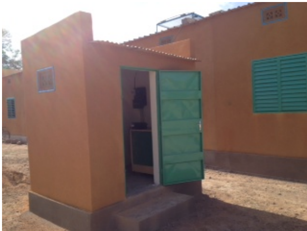
Local énergie où les batteries du collège ont été réinstallées