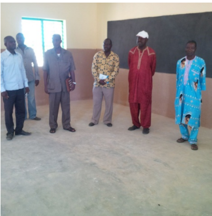
Le comité dans une salle de classe