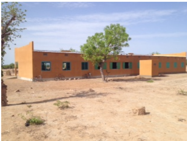
Vue arrière du collège avec le local énergie