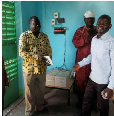
Remise des clés à l'intendant du CEG