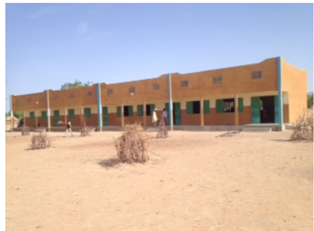
la façade du collège