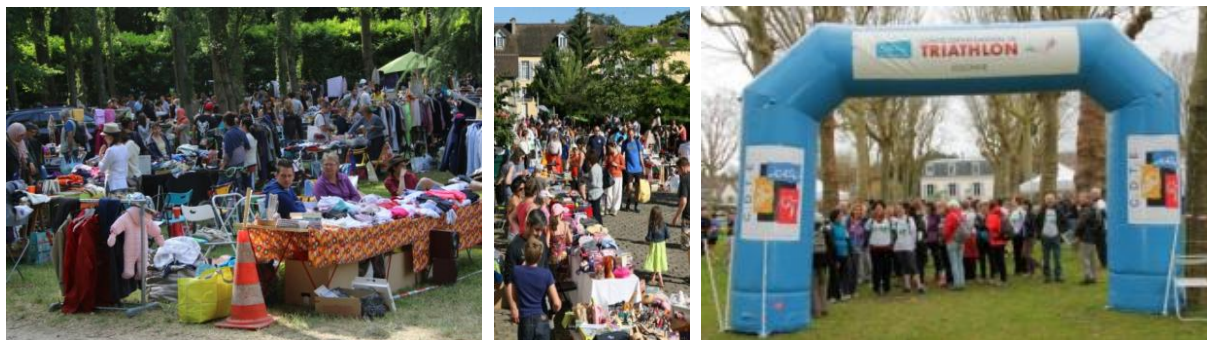
Activités sur Verrières (Brocante, marché aux puces des enfants, Buissonnière)

Ensuite, le président a présenté le rapport moral , cédant la parole au fur et à mesure aux membres du CA qui ont chacun présenté un bilan succinct de leur activité.